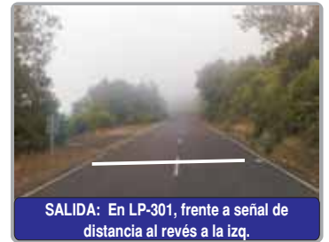
SALIDA: En LP-301, frente a señal de distancia al revés a la izq.