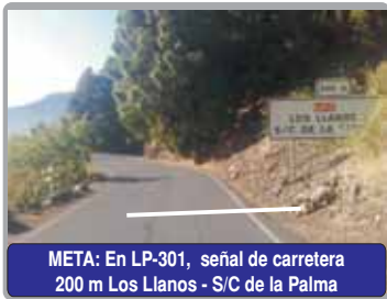
META: En LP-301, señal de carretera 200 m Los Llanos - S/C de la Palma