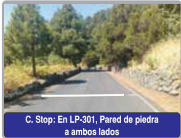
C. Stop: En LP-301, Pared de piedra a ambos lados