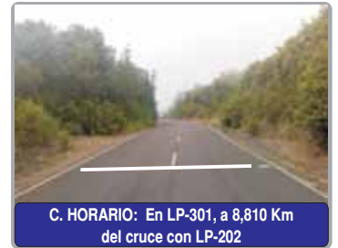
C. HORARIO: En LP-301, a 8,810 Km del cruce con LP-202